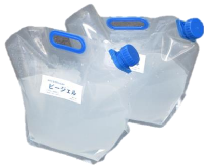
樹脂系低減材「ピージェル」 PG-4000

軽くて強く、安価で安全な、環境に優しい 次世代のガードパイプ接地棒と、水の 配合が必要なく、開栓して流し込む 粉塵吸引の危険が無い、樹脂系 接地抵抗低減材「ピージェル」を 使用する簡単な工法です。