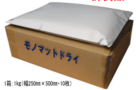
1箱: 1kg (幅250mm x 500mm・10枚)

樹脂系接地抵抗低減材「イージェル」の粉末を、長繊維不織布に混入した接地シート「モノマットドライ」は、用途が多様で様々な場所で使用できる今までにはない製品です。